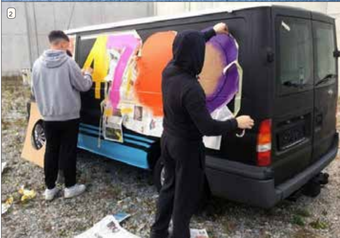
Foto links: Jugendliche gestalten den Bus in einem kreativen Prozess.

beitsalltag als Wertstoff-Sammel-Insel. Einmal wöchentlich wird er zum ASZ gefahren und dort fachkundig und sortenrein geleert.