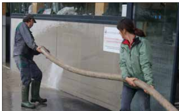
Reinigungsarbeiten nach dem Hochwasser.

„All diesen Fragen und Zweifel muss man freundlich begegnen“ , sind sich die Mitarbeiter des ASZ Schär- dings einig. Auch schöne Momente, wenn man Kundschaften bei