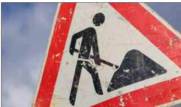
Damit der Abbruch nicht zur Kostenfalle wird, unbedingt vorher mit dem Bezirksabfallverband Kontakt aufnehmen!

Keine Analyse = Strafe! Wird keine Analyse durchgeführt, hat man aus rechtlicher Sicht Abfall eingebaut und muss daher Strafe zahlen. Zusätzlich wird die Altlastensanierungsabgabe fällig (dzt. € 9,20/to). In schwerwiegenden Fällen muss der Abfall wieder entfernt und fachgerecht entsorgt werden.