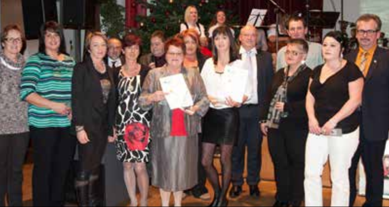
Urkundenübergabe an die ASZ Schär- ding und St. Georgen an der Gusen im Rahmen der Weihnachtsfeier der OÖ LAVU AG.