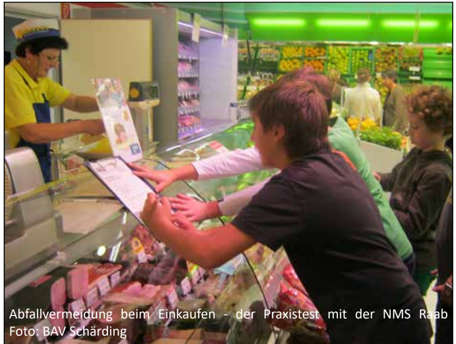
Abfallvermeidung beim Einkaufen - der Praxistest mit der NMS Raab

Nach einer Schulstunde, ASZ Führung, ... erhalten die TeilnehmerInnen