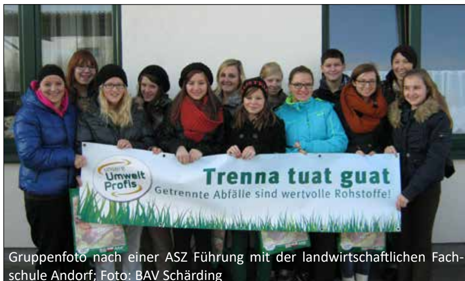
Gruppenfoto nach einer ASZ Führung mit der landwirtschaftlichen Fachschule Andorf; Foto: BAV Schärding