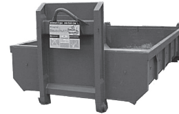
12 m 3 Abrollcontainer