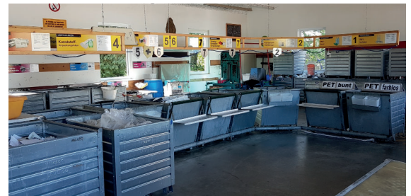
Kunststofftrennung im ASZ

Die getrennte und sortenreine Sammlung von über 80 unterschiedlichen Altstoffen im ASZ ermöglicht eine hohe stoffliche Verwertung und somit ein ökologisch und wirtschaftlich sinnvolles Recycling. Die erzielten Erlöse fließen in den Ausbau der ASZ-Infrastruktur und entlasten die Abfallgebühren. An dieser Stelle sei erwähnt, dass vom Inhalt des Gelben Sackes (nur) circa 40% stofflich verwertet werden können.