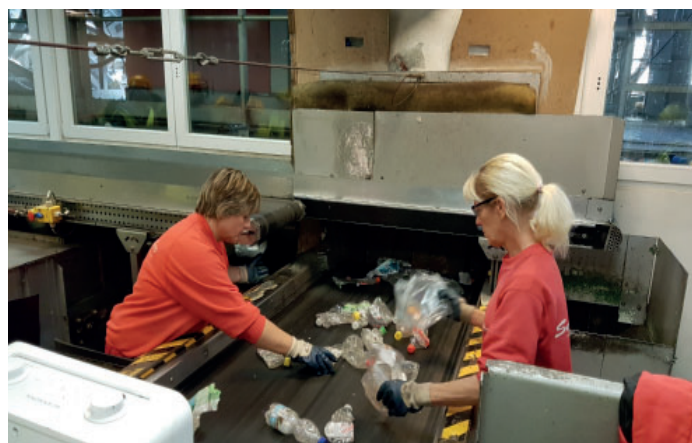
Folien und händische Kunststoffsortierung