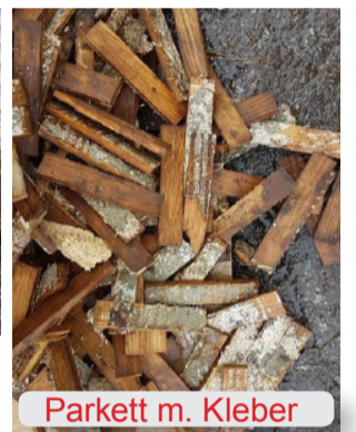
Parkett m. Kleber