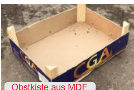
Obstkiste aus MDF