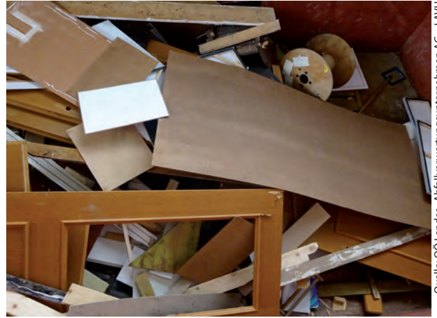
Gefüllter Altholzcontainer „Altholz stofflich“