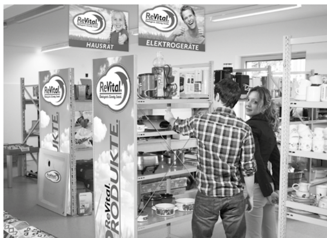
ReVital Partner Recyclinghof Braunau

Gebrauchte, aber gut erhaltene und einwandfrei funktionierende Elektrogeräte, Möbel, Sport- und Freizeitgeräte sowie Hausrat werden in ausgewählten oberösterreichischen Altstoffsammelzentren kontrolliert gesammelt, ihre Aufbereitung in qualifizierten oberösterreichischen Einrichtungen durchgeführt und die revitalisierten Produkte an die Verkaufsstellen der jeweiligen Partner geliefert.