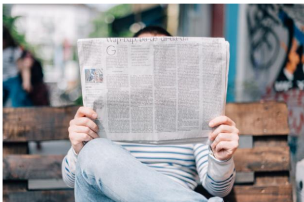
Für viele ein tägliches Ritual: das Lesen der aktuellen Zeitung