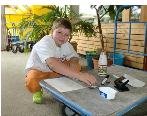
Ferienpassaktion im ASZ Freistadt