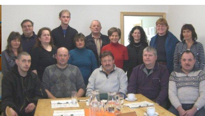
13 neue ASZ-MitarbeiterInnen nahmen an der Einschulung durch den BAV teil.