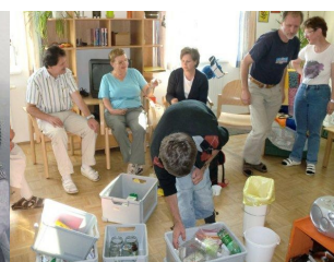
Abfallkonzept für Lebenshilfe Freistadt