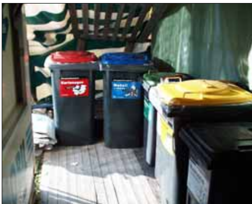
Abfalltrennungs-Zentrale neben dem Geschirrmobil am Musikfest Schildorn

Beim Musikfest in Schildorn im Juni 2001 waren die Tonnen zum ersten Mal im Einsatz und haben sich gut bewährt!