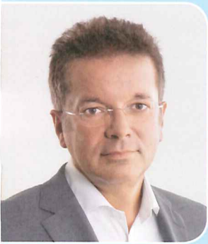
Rudi Anschöber Landesrat für Umwelt, Energie, Wasser und KonsumentInnenschutz

Mehrwegflaschen werden wiederbefüllt. Das spart Rohstoffe, schützt das Klima und vermeidet Abfall. Mehrwegflaschen schneiden in allen Ökobilanzen besser ab als Einwegflaschen und Dosen. Der Handel bietet jedoch Mehrwegflaschen immer weniger an. Viele Konsumentinnen und Konsumenten sowie Organisationen wollen das nicht mehr hinnehmen.